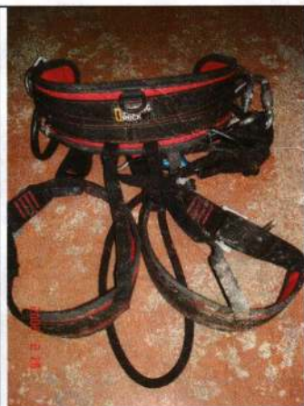
- ochranné pracovní pomůcky

Školení provedeno podle zákona č. 262 / 2006 Sb. / Zákoník práce / zápis o školení pracovníků vykonávajících práce ve výškách.